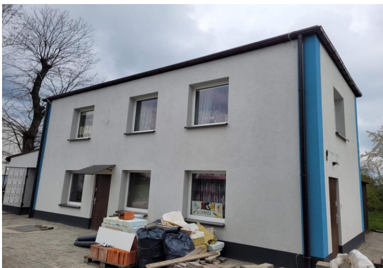
Remont elewacji budynku sołectkiego w Szczerbicach