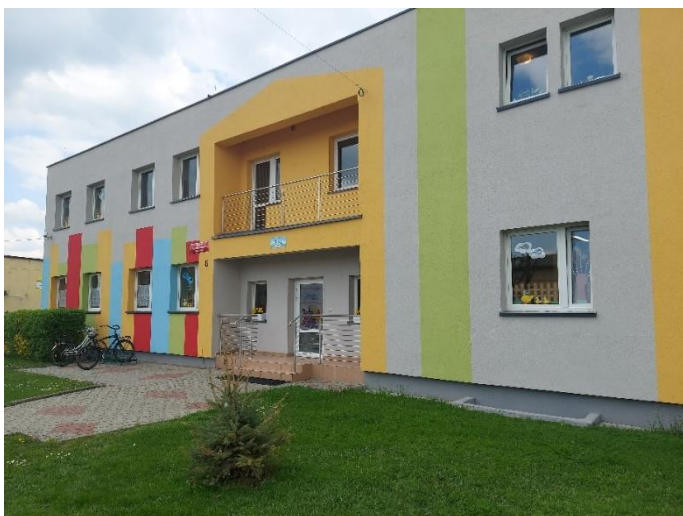
Elewacja zewnętrzna Przedszkola w Gaszowicach