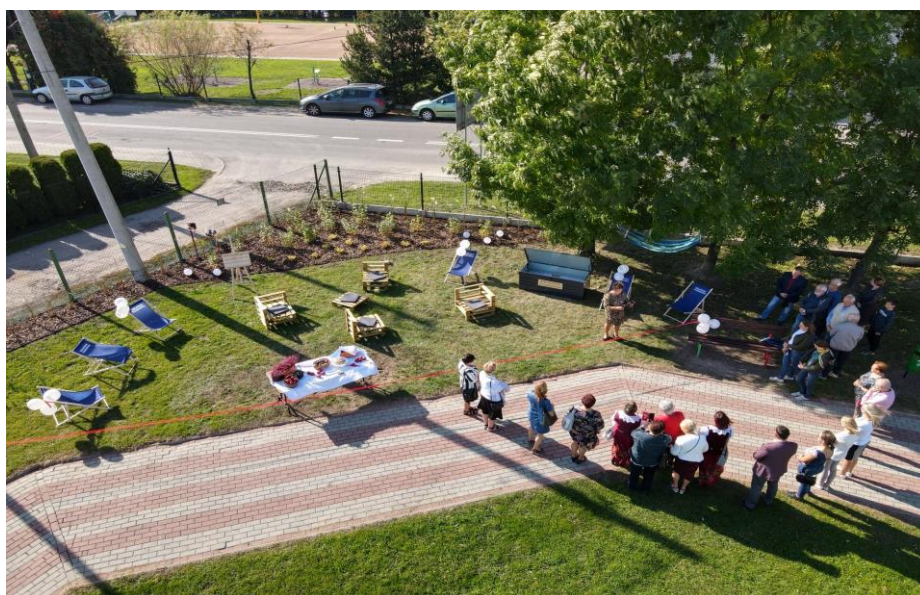
Uroczyste otwarcie biblioteki plenerowej