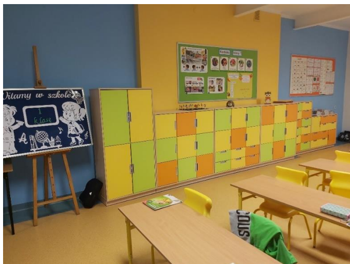
Klasa lekcyjna w SP Piece