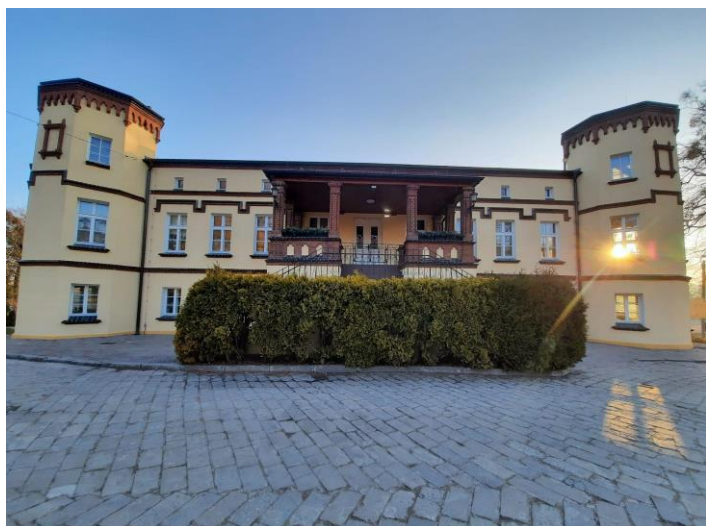
Pałac po remoncie elewacji

Jesienią po zwolnieniu obostrzeń związanych z Covid 19, wróciły do Ośrodka Kultury zajęcia stałe, spotkania zespołów, grup, wolontariuszy, harcerzy, seniorów, klubów oraz kół zainteresowań. Ośrodek Kultury stał się znowu miejscem spotkań i przestrzenią dla ludzi mających pasję i chęci do działania. Dla dorosłych została zorganizowana zabawa andrzejkowa „Powrót do przeszłości” . Odbył się konkurs jesienny pt. „Strach na wróble” oraz dla dzieci wydarzenie pt. „Festiwal Strachów”. Pod koniec roku w okresie świątecznym zorganizowano Jarmark Gminny połączony z koncertem zespołu „Chwila Nieuwagi” oraz czernicką choinką. W połowie roku Gmina Gaszowice otrzymała dofinansowanie na remont elewacji oraz wymianę okien i parapetów . Dzięki tym działaniom budynek stał się bezpieczniejszy do użytkowania w kolejnych latach, a także zyskał pod względem estetycznym i funkcjonalnym.