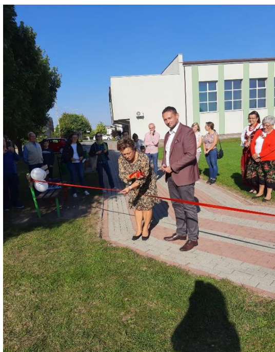
Otwarcie biblioteki plenerowej

W Gaszowicach rozpoczęto tworzenie biblioteki plenerowej , która ma służyć wszystkim mieszkańcom. Biblioteka w plenerze ma na celu promocję czytelnictwa oraz integrację społeczeństwa.