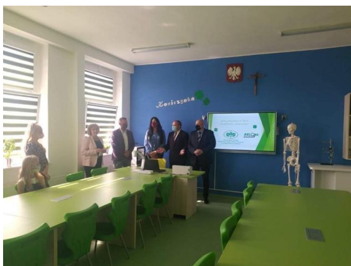
Zielona Pracownia w ZSP Szczerbice