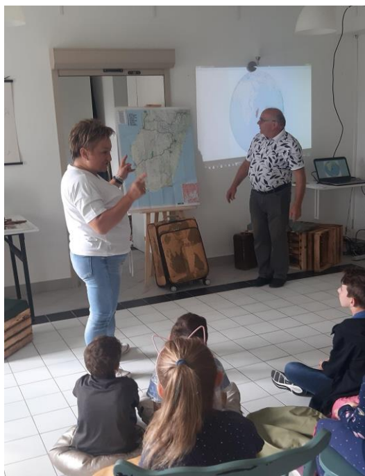
Spotkanie z podróżnikiem