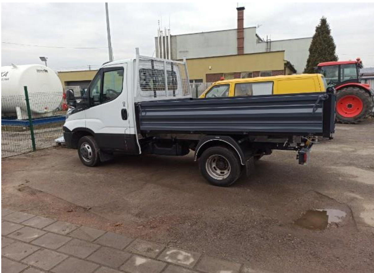
Samochód ciężarowego IVECO DAILY 35C15 typu wywrotka