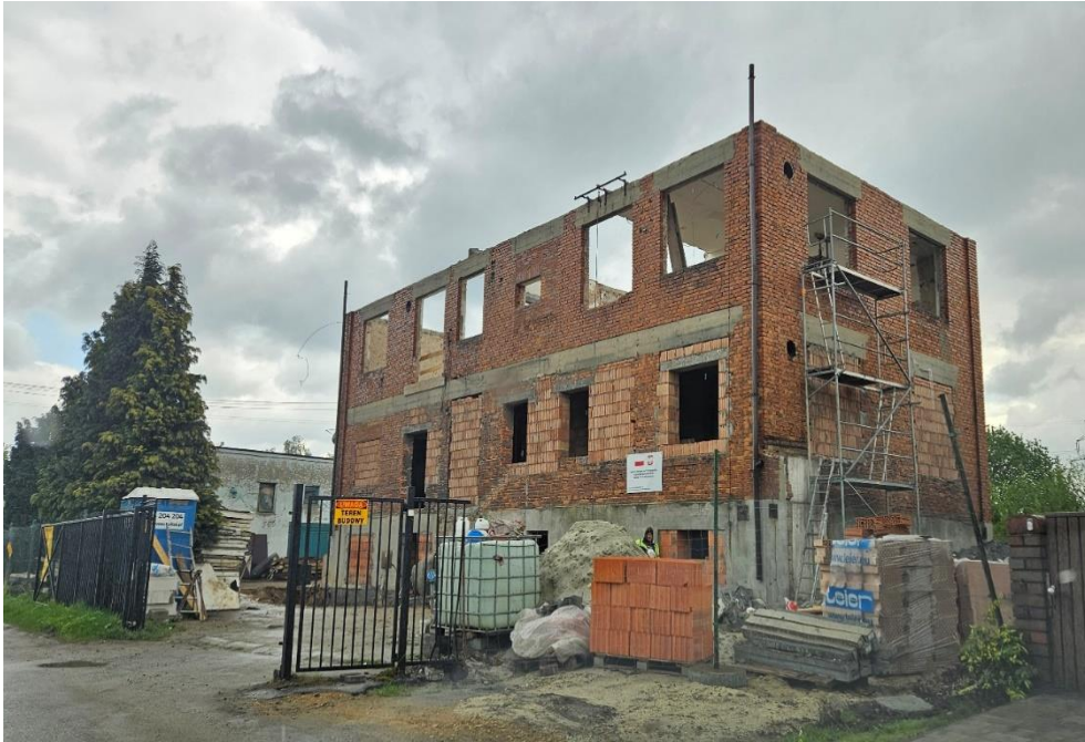
Przebudowa fabryki w Piecach na mieszkania komunalne