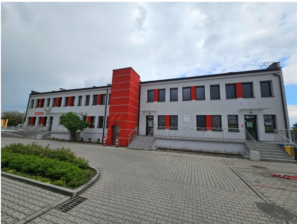
Budynek administracyjno – biurowy w Gaszowicach po termomodernizacji