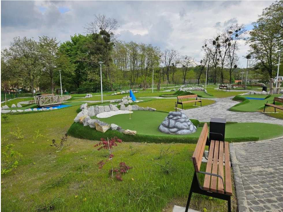
Mini golf przy Ośrodku Kultury w Czernicy