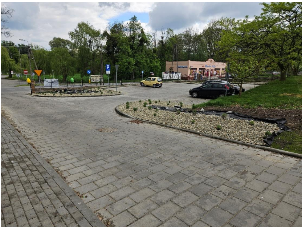
Zagospodarowanie teren wokół Ośrodku Kultury w Czernicy